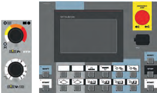
RTR CONTROL PANEL: MITSUBISHI (A-CNC)